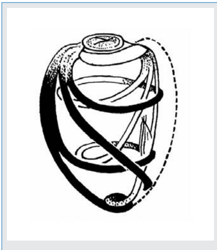
Abb. 1: Faserverlauf in der linken Herzkammer des Menschen (nach Benninghoff)

wenige echte Quellwässer haben noch eine ganzheitliche Qualität, aber auch nur, wenn man sie schonend abfüllt und darüber hinaus nicht auch noch mit UV-Licht sterilisiert und / oder mit Kohlensäure konserviert.