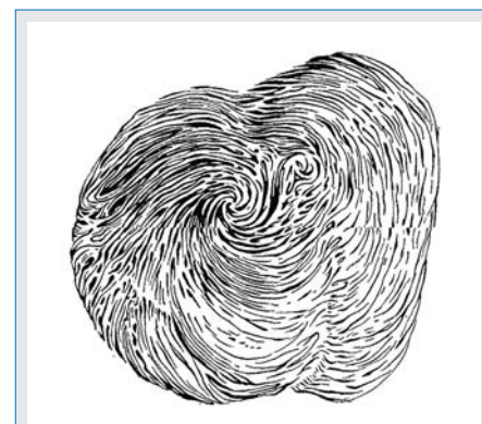
Abb. 2: Ansicht der Herzspitze mit lemniskatischer Muskelanordnung